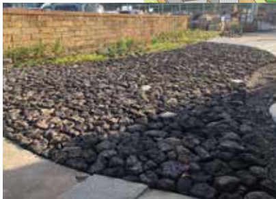
浅間溶岩を使ったアプローチは 見応えがあります