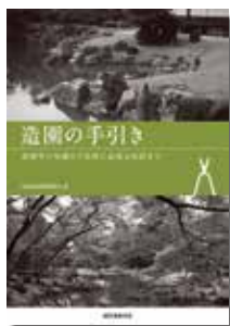
『造園の手引き』 教科書として社内で 読み合わせています