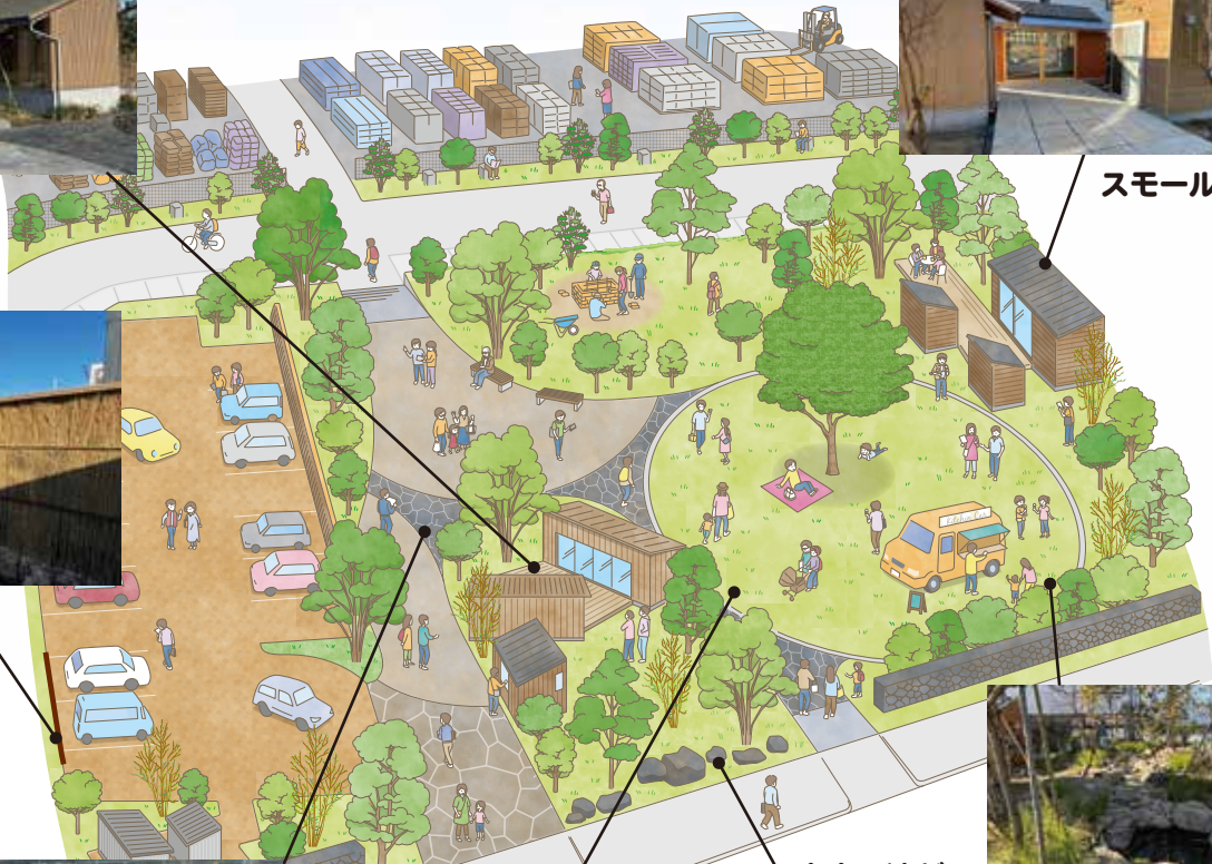
大小の池が できました